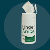
Lingettes, emballages de sets, essuie-mains