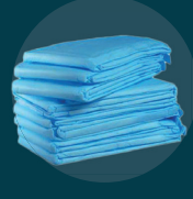
Alèses jetables, protections/changes