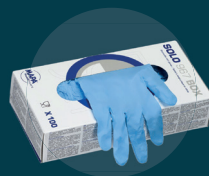
Gants jetables, surblouses, masques