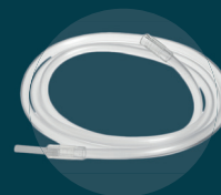
Tubulures et poches d'alimentation entérale