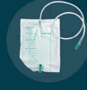
Poches à urine, étuis péniers, poches de stomie, sondes rectales