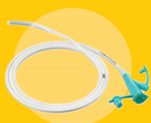
Sondes : vésicales, d'aspiration ou gastriques