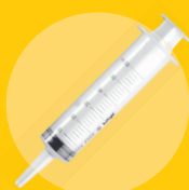
Seringues, drains, canules