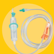
Dispositifs de perfusion