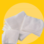
Compresses et pansements souillés